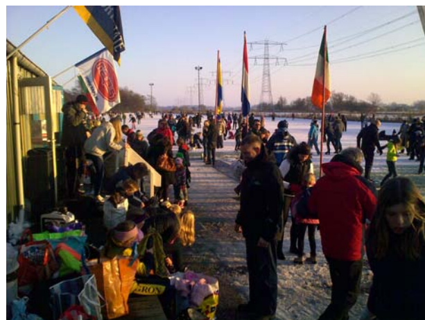
Drukke op onze ijsbaan op 3 januari 2010